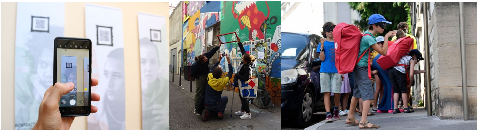
Portraits Mobiles